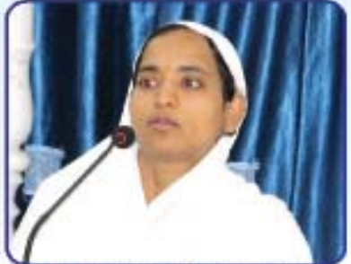
બા. ડ્ર. આદ. શ્રી અલકાબેન