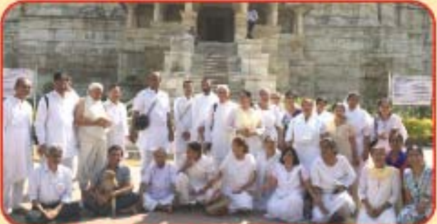
તીર્થના ઉછરંગી જાત્રાળુઓ, રાણકપુર