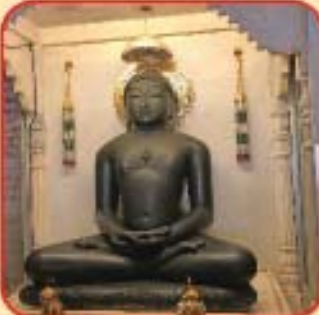
શ્રી મુનિસુવ્રત ભગવાન સ્વસ્તિધામ, જહાઝપુર