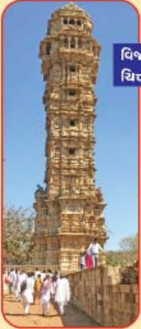
વિજયસ્તંભ, ચિત્તોડગઢ કિલ્લો