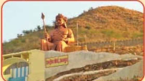
પ્રતાપ ગૌસ્વ કેન્દ્ર, રાષ્ટ્રીય તીર્થ, ઉદેપુર