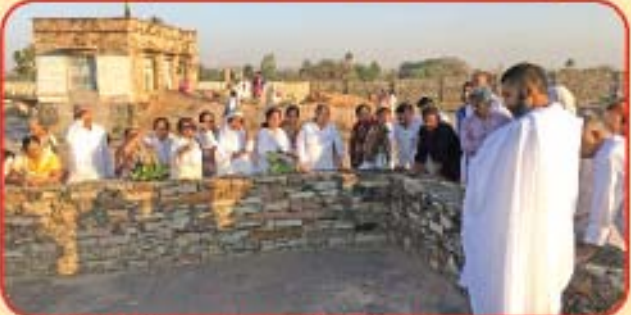
શ્રી પાર્શ્વનાથ પ્રભુ પર કમઠે કરેલ ઉપસર્ગ સ્થળ, ઢિજોલીયા