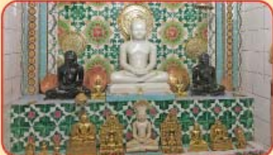
શ્રી શાંતિનાથ પ્રભુ, બીચ્છુવાડા દિગંબર જૈનમંદિર