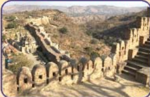
ભારતની 'ચાઈના વૉલ', કુંભલગઢ