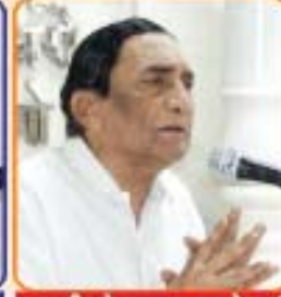
પદાશ્રી ડો. કુમારપાળ દેસાઈ