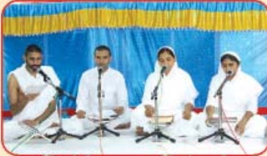
ભક્તિસંગીત : યુવાભક્તિવૃંદ, સોબા