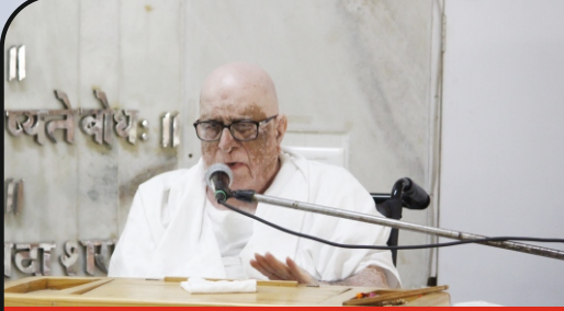
પૂજ્યશ્રીની પાવન નિશ્રા