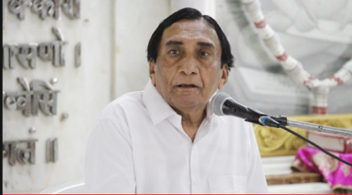
પદ્મશ્રી ડૉ. કુમારપાળ દેસાઈ