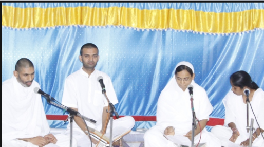
યુવાસાધક વૃંદ, કોબા