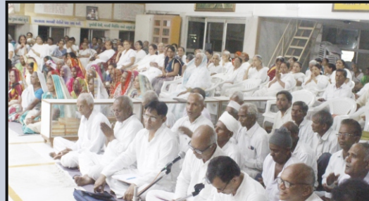
પૂ. લાલજીબાપા મુમુક્ષુમંડળ (ભક્તિસંગીત)