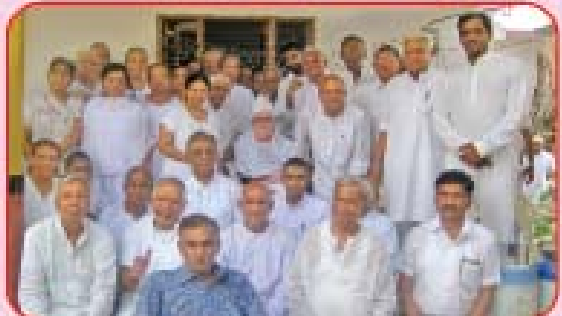
યાત્રિકોની સમૂહ તસવીર