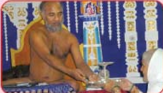
સંસ્થાને ધાર્મિક ઉપકરણોની ભેટ આપતા અચાર્યશ્રી