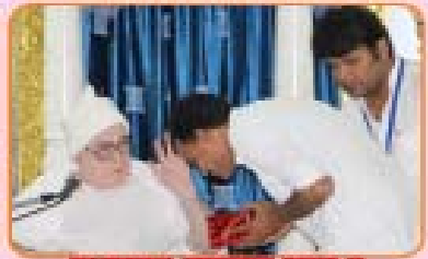
ઈનામ વિતરણ વેળાએ