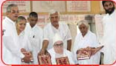
સંસ્કારગ્રંથોની સ્થાપના વેળાએ

‘સુવનસંધ્યા’ વૃદ્ધાશ્રમમાં આપણી સંસ્થા આયોજિત ચાઈરોઈડ કેમ્પ (તા. ૧૧-૧૦-૨૦૧૫)