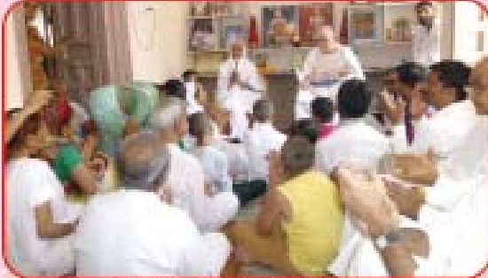
બા.હા. શ્રી અસતારોનના નિવાસસ્થાને યોજાયેલ ભક્તિ (ચીતરી)