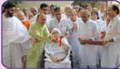
'ગુરુદિવાન'ના ઉદ્ઘાટનની વેળાએ (તા. ૨-૧૨-૨૦૧૫)