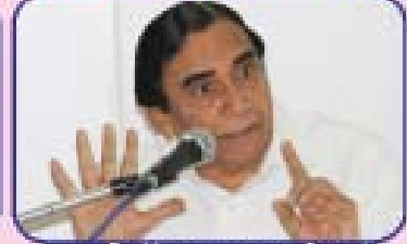
પદ્મશ્રી ડૉ. કુમારપાળ દેસાઈ