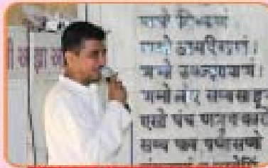
‘કીન બનેગા જ્ઞાનપતિ’ કવીઝ