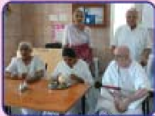
ભૂજમાં નેચરોપેશી કેન્દ્રમાં ઉપસ્થિત કોબાના મુમુક્ષુઓ