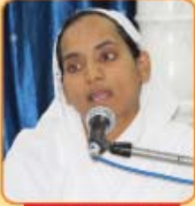
બા. બ્ર. અલકાબેન