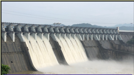
સરદાર સરોવર ડેમ