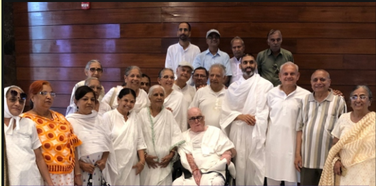
સ્ટેચ્યુ ઓફ યુનીટીમાં પૂજ્ય સાહેબજીના સાન્નિધ્યમાં