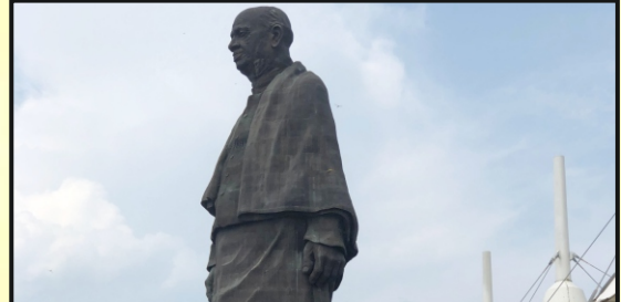
રાષ્ટ્રીય એકતાના પ્રતીકસમ લોહપુરુષ સરદારનું વિશ્વનું સૌથી ઊંચું સ્ટેચ્યુ