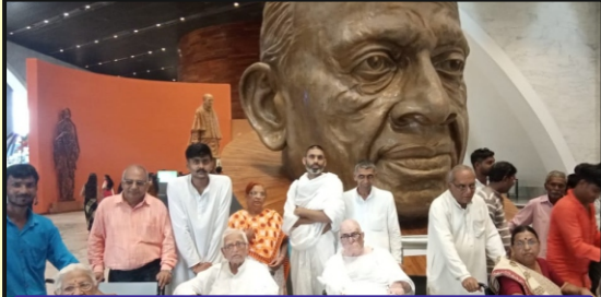
સ્ટેચ્યુ ઓફ યુનીટીમાં સરદારનું લાક્ષણિક દર્શન