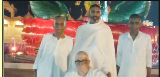
પોઈચા ગામના સ્વામિનારાયણ સંસ્થાનમાં