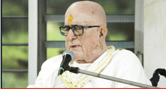
પૂજ્યશ્રીની પાવન નિશ્રા