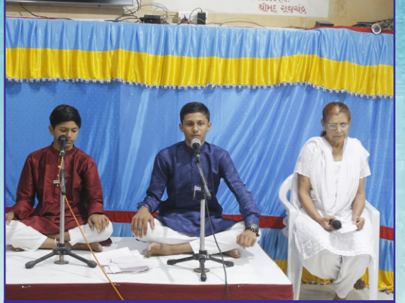
ગુરુકુળના વિદ્યાર્થીઓ - ભક્તિસંગીત