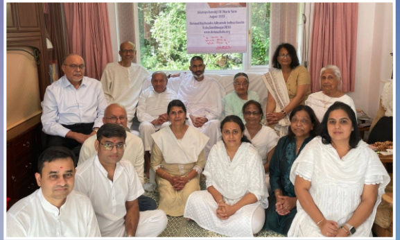
આદ. જયંતિદાદા તથા આદ. પુષ્પાબાના નિવાસસ્થાને