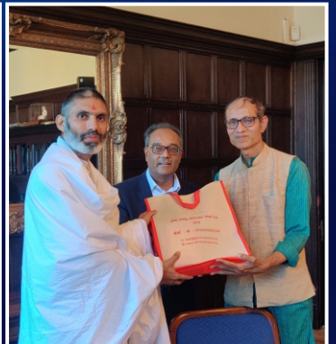
પોર્ટરબાર દેરાસર, લંડન (યુ.કે.)