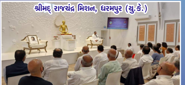
શ્રીમ્ રાજચંદ્ર મિશન, ધરમપુર (યુ.કે.)