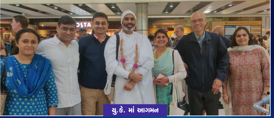
યુ.કે. માં આગમન