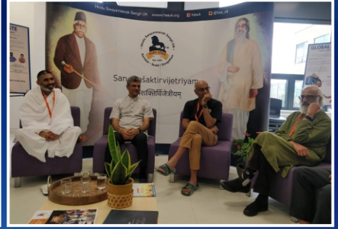
H.S.S. હેડક્વાર્ટર્સ, લેસ્ટર